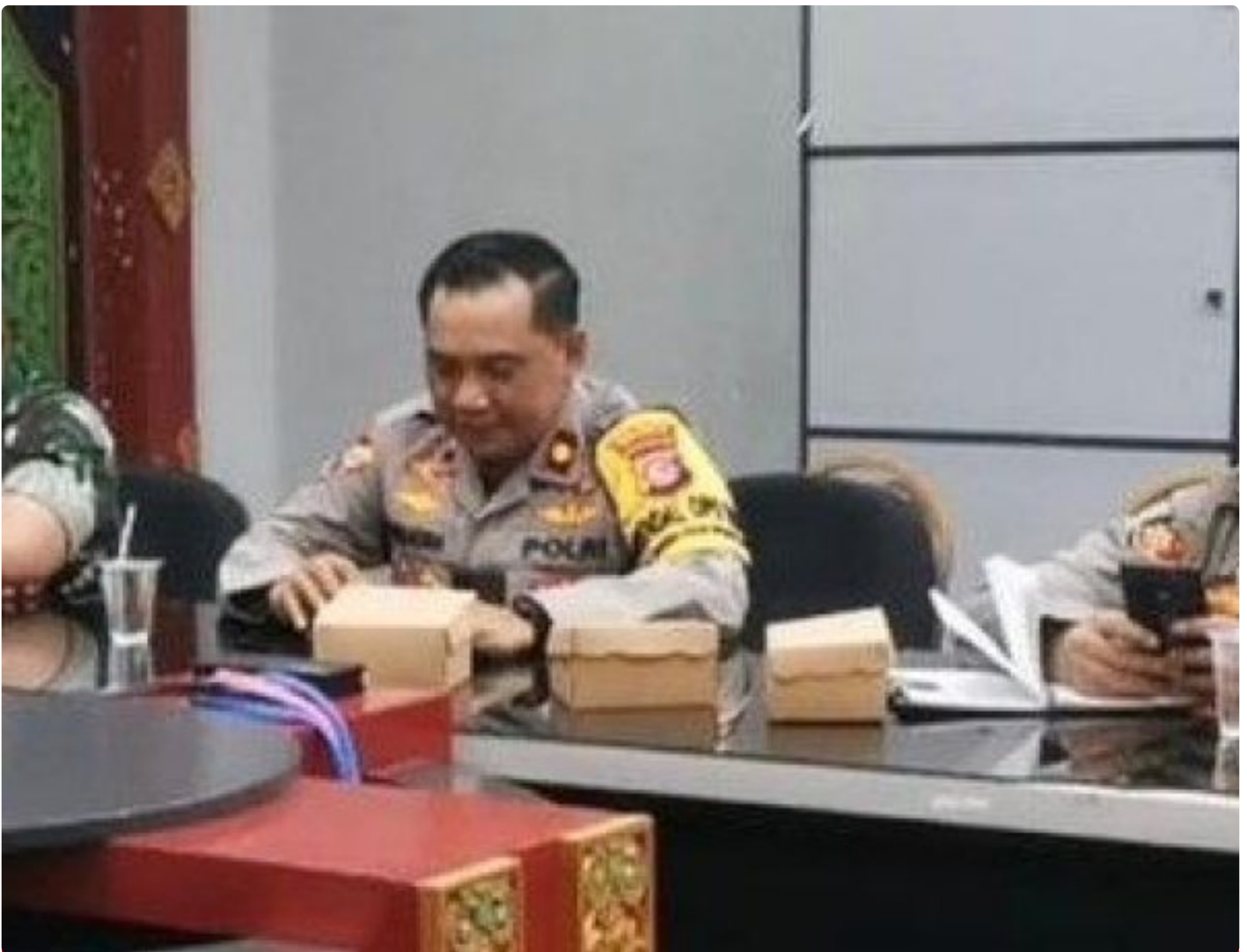
Kabagops Polresta Mataram saat menghadiri Rakor di Kantor Bupati Lombok Barat, Selasa (10/12/2024)

MATARAM, NTB – Dua tradisi budaya ikonik, Pujawali dan Perang Ketupat, akan